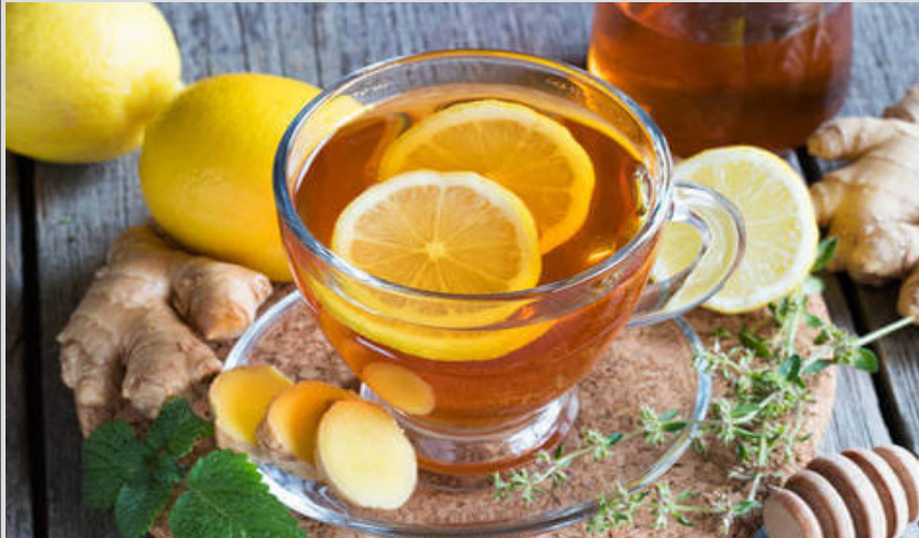
Image d'une infusion

Une alimentation riche en graisses polysaturées et un mode de vie sédentaire favorisent l'obstruction des artères. La circulation du sang vers le cœur cesse donc d'être fluide. Si ce problème n'est pas traité à temps, il peut s'avérer fatal, et déboucher sur l'apparition sur l'angine de poitrine, les AVC, l'infarctus, les crises cardiaques. Certains aliments peuvent aider à nettoyer naturellement les parois artérielles. Grâce à ces aliments, le sang peut circuler librement dans le corps, et l'oxygène, les antioxydants et les nutriments peuvent remplir correctement leurs fonctions.