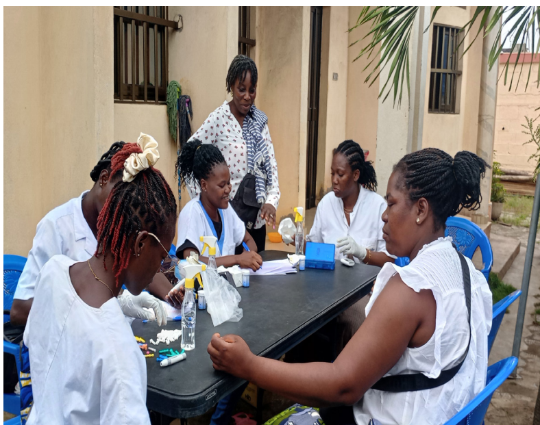
Séance de dépistage au marché de Hanoukopé

La sensibilisation s'est poursuivie au Centre Régional d'Étude et de Formation en Énergies Renouvelables