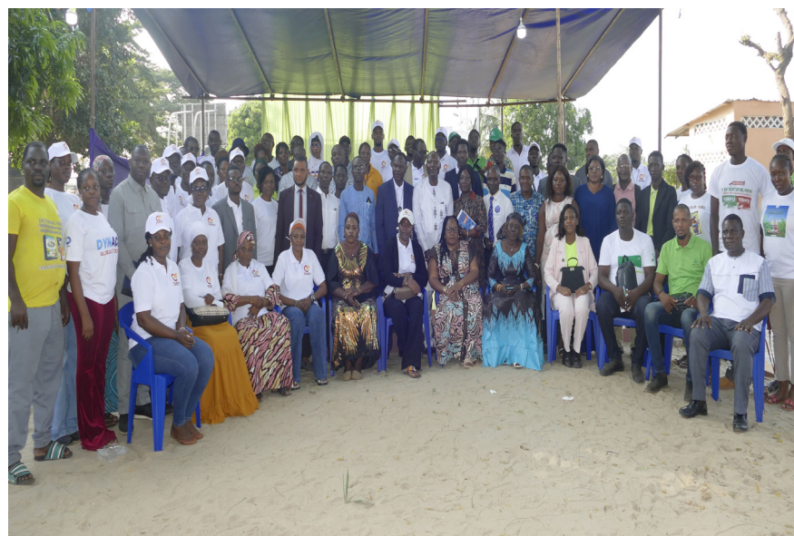
Photo de famille des participants lors du congrès

Ce congrès a aussi permis aux producteurs et promoteurs de