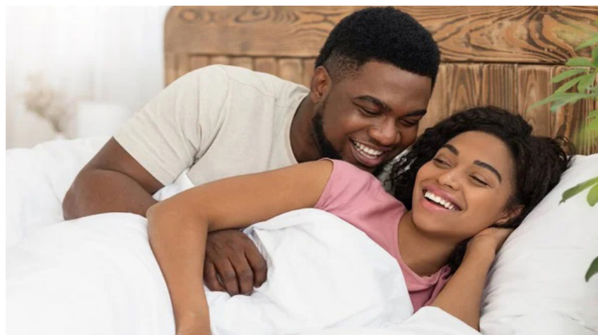
Image d'un couple heureux

Comment avoir une relation sexuelle plus épanouissante avec son mari ou sa femme ? Lorsqu'on est connecté émotionnellement. C'est là que l'intimité émotionnelle entre en scène. Pour maintenir le désir sexuel, la réponse est d'entretenir ou augmenter la proximité émotionnelle avec son mari ou sa femme. L'intimité au quotidien peut également augmenter le désir sexuel.