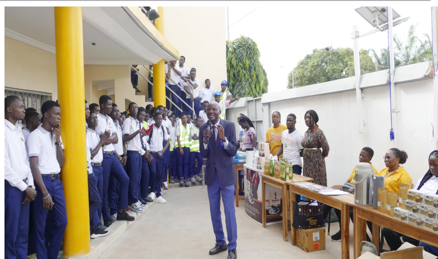
Image de séance de sensibilisation au CREFER

Les exposants de sociétés de compléments alimentaires, tels que SHINEWAY Healthcare, CHAMPISO et MAIVIT ont de leur côté souligné