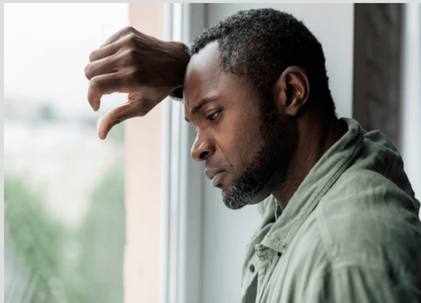
Image d'un homme anxieux

Ces réflexions permettent d'identifier des solutions plus saines. Il peut être utile de ralentir progressivement, d'alléger son emploi du temps et de laisser des