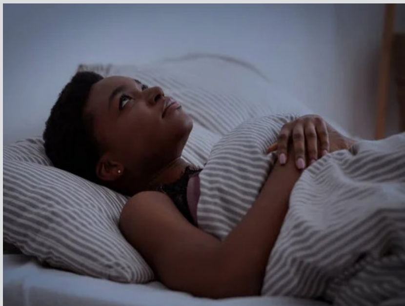
Image d'une personne souffrant d'insomnie

Les symptômes sont multiples. Être épuisé(e) mais ne pas parvenir pas à s'endormir, se réveiller vers 3 ou 4 heures du matin, avec une sensation d'oppression, ressentir des tensions musculaires au