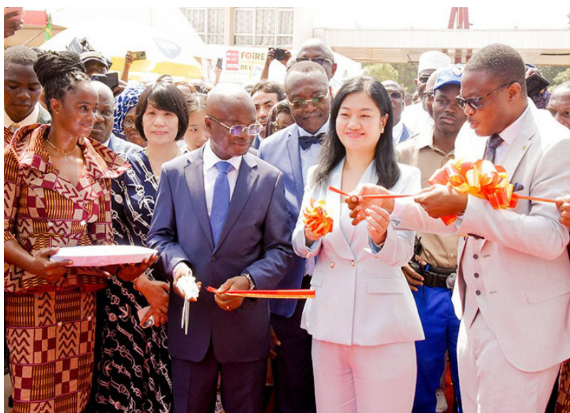
Photo de coupure du ruban