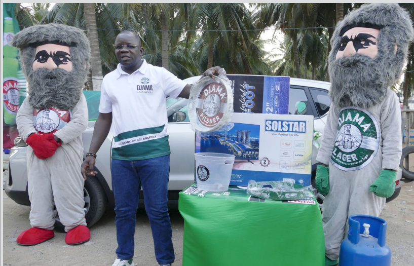
Photo de présentation de quelques lots à gagner durant le jeu

La Société Nouvelle de Boissons (SNB) a procédé au lancement de la troisième édition du Jeu Capsules Consommateurs (JCC), le mercredi 26 novembre 2025 à Lomé. Ce jeu promotionnel, désormais incontournable, vise à renforcer les liens entre la marque DJAMA et ses consommateurs tout en offrant une expérience interactive, divertissante et riche en récompenses.