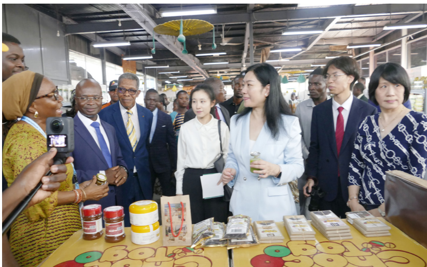
Visite des stands par les officiels

un lieu de rencontres stratégiques et un incubateur de partenariats. « Le thème invite à revisiter le chemin parcouru, à honorer tous ceux et celles qui, depuis 1985, ont contribué à faire de la Foire une vitrine majeure, tout en nous projetant vers des horizons nouveaux de modernité et de compétitivité mondiale. », a précisé le Ministre Kossi Ténou.